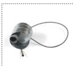
Clapet feu ouvert