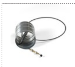
Clapet prise d'air extérieure