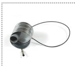
Klappe für offenen Kamin